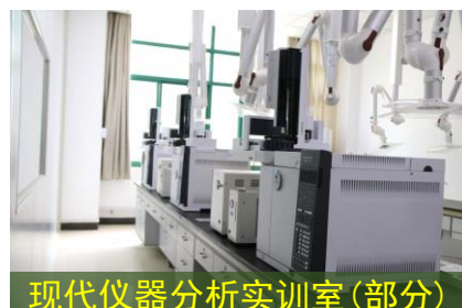
现代仪器分析实训室(部分)