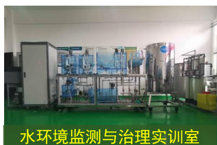
水环境监测与治理实训室