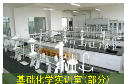
基础化学实训室(部分)