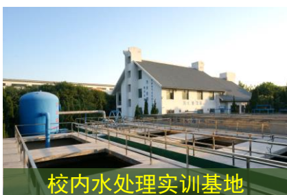
校内水处理实训基地