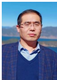
赵俊伟 博士 教授 河南大学博士生导师，河南省特聘教授、河南省学术技术带头人