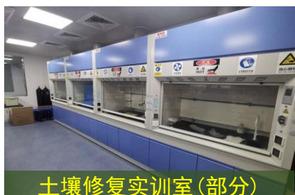
土壤修复实训室(部分)