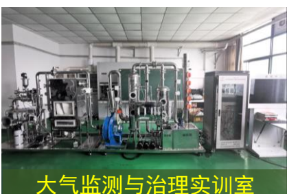
大气监测与治理实训室