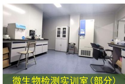
微生物检测实训室(部分)